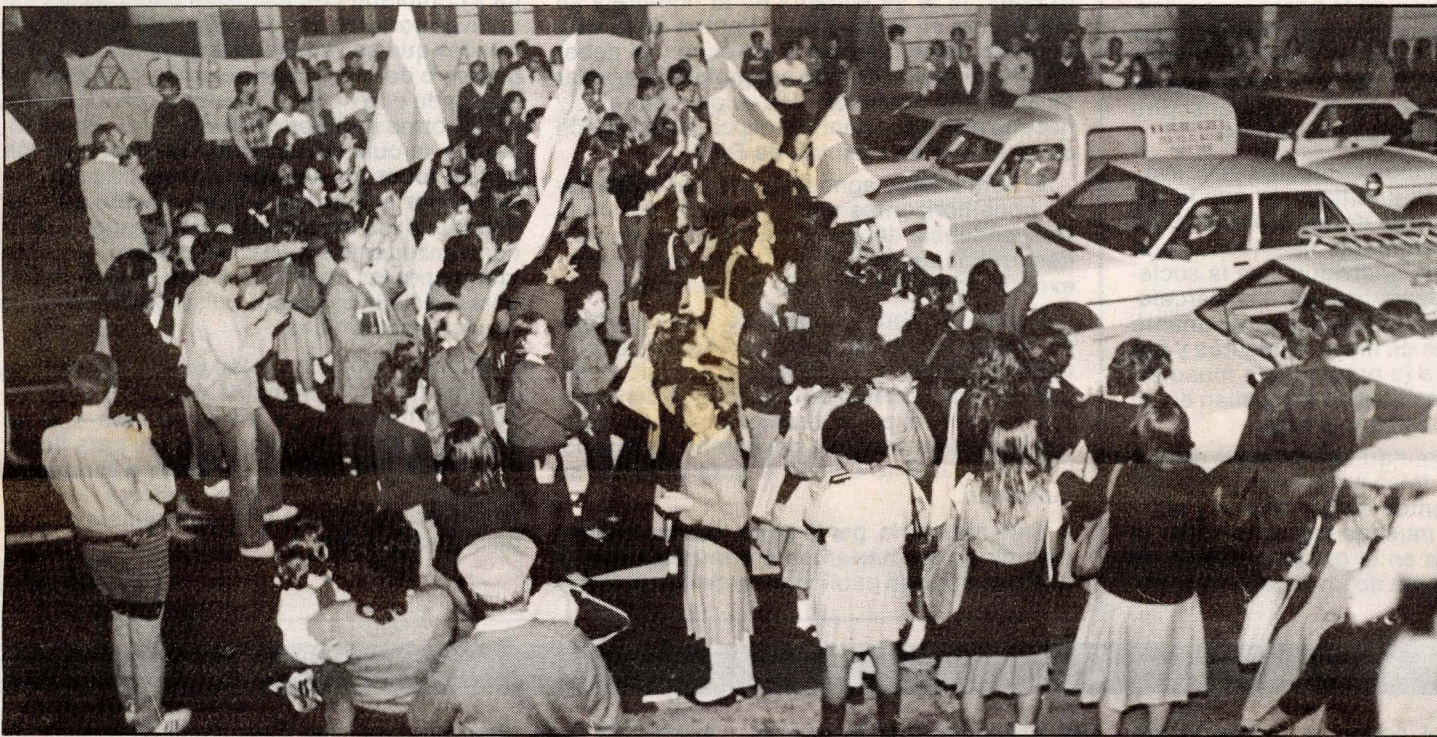
Un grupo de personas, en su mayoría jóvenes estudiantes de instituto, cortó el tráfico ayer en la calle Bravo Murillo, a la altura del Cabildo.