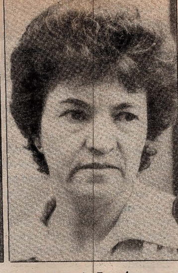
Sra. de Franchy

que todos los españoles tenemos derecho a recibir una educación. Es totalmente nefasto haber pasado el CULP a depender de La Laguna. Los políticos no tienen derecho a hacer lo que han hecho con lo nuestro.