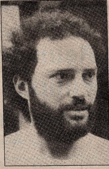
Carlos Santana Quesada