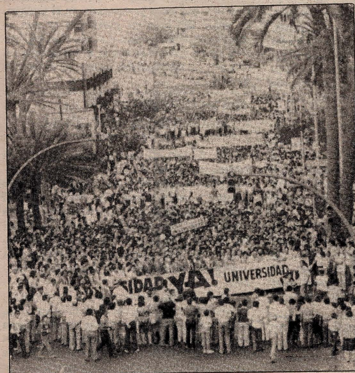
Manifestación celebrada en 1982, pidiendo la ampliación de los estudios universitarios.

—Asistí a la otra y asistiría a cualquiera que convocasen, ya que la cara hay que darla hasta el final.