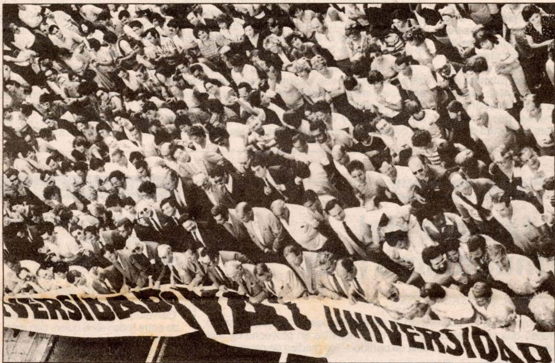
Esta fue la cabeza de la manifestación de hoy hace un año en Las Palmas en favor de su Universidad.