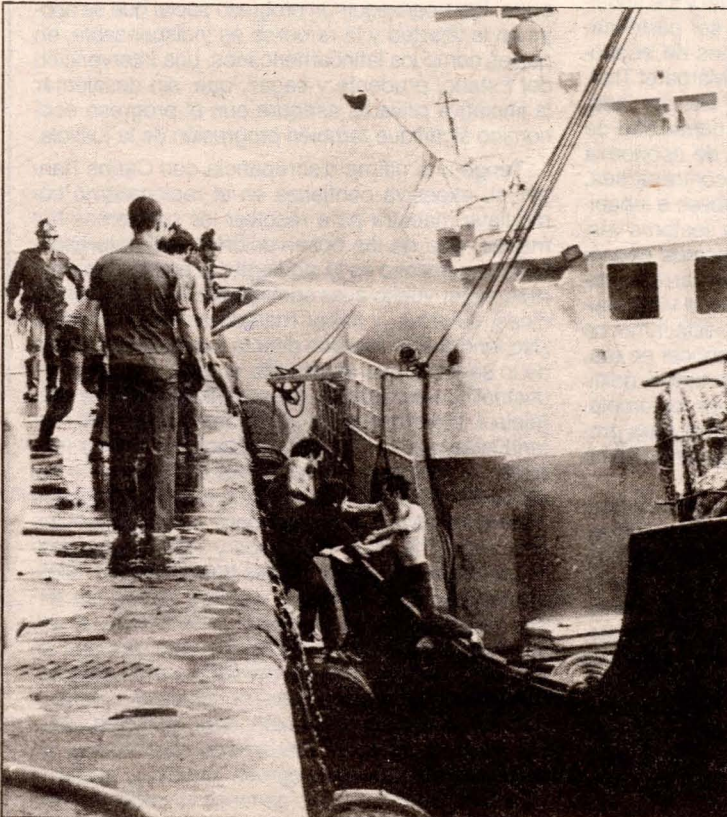
Dos tripulantes del Asón ayudan a un compañero a abandonar el pesquero incendiado.

El pesquero español Asón sufrió ayer un incendio en el Dique del Generalísimo, del Puerto de La Luz, a causa del fuego que se produjo en la cocina del mismo. Varios tripulantes