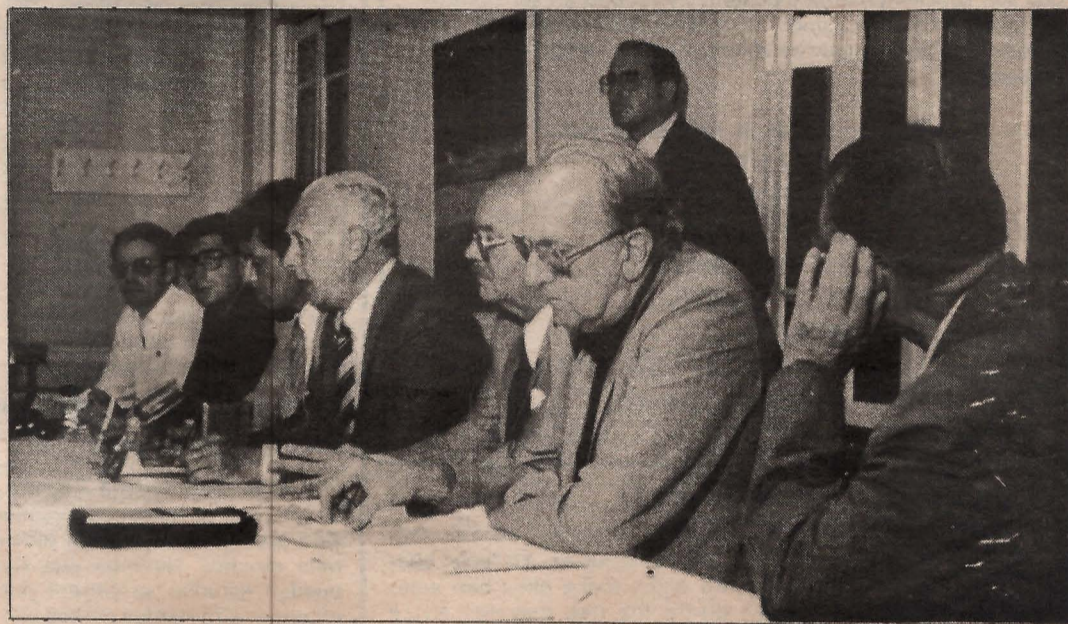
En la rueda de prensa los promotores de la asamblea de 1972 expresaron su disgusto por lo acontecido, y afirmaron que continuará la reivindicación por la Universidad de Las Palmas.