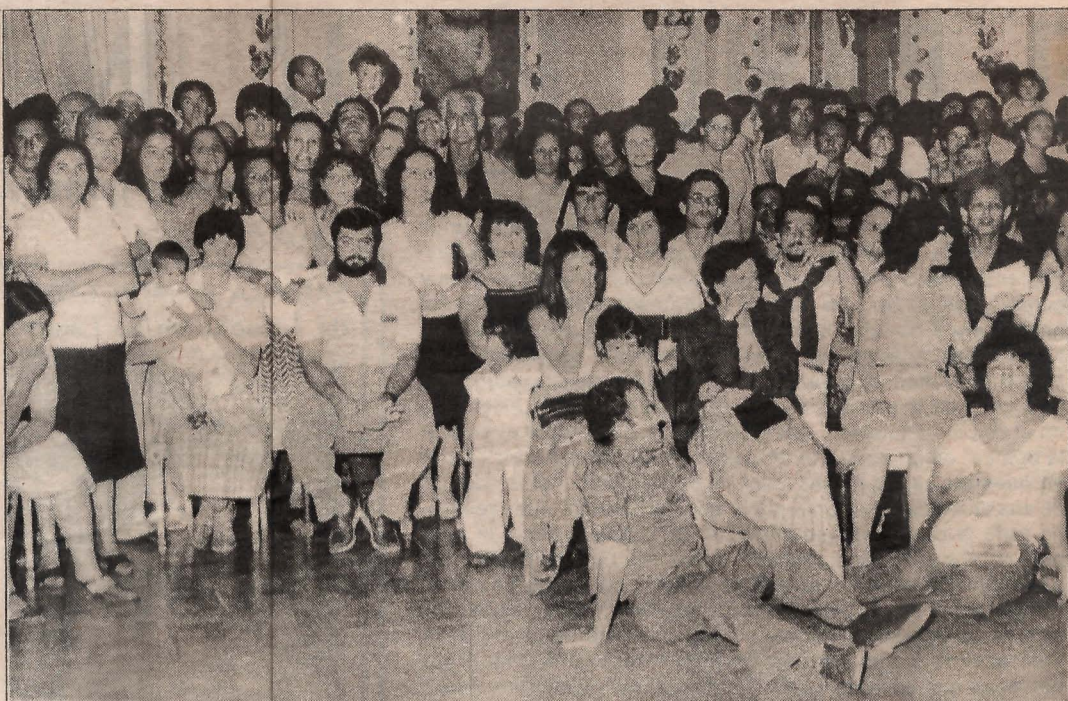
Gran número de miembros de la coordinadora de la vivienda acompañados de sus hijos tuvieron que sentarse en el suelo debido a que el salón no estaba preparado porque no había prevista una asamblea.