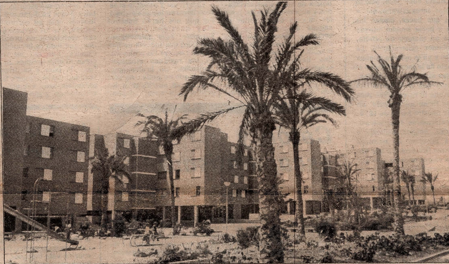
Polígono de Las Remudas

También está previsto que el Consejo de Ministros