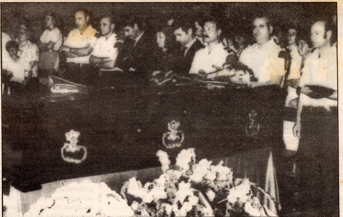
Funeral en Baracaldo por el jefe de su Policía Municipal, asesinado por ETA.