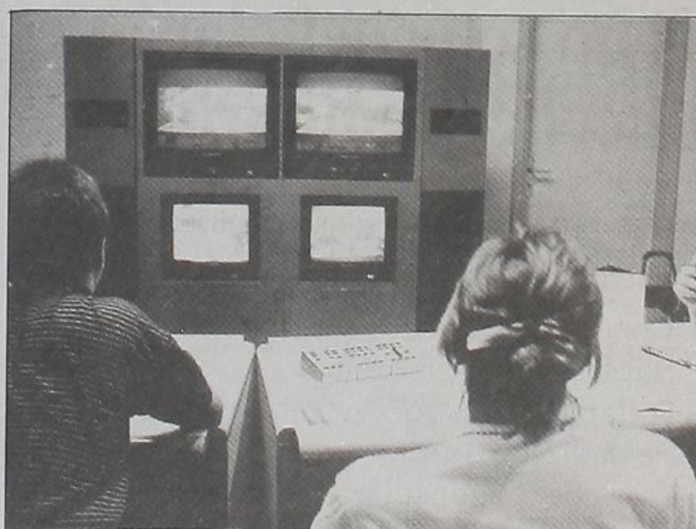
Un momento de la videoconferencia de prensa entre Tenerife y Las Palmas.

También han visto que el coste de estas videoconferencias es un poco elevado, aunque los organismos interesados estudian obtener unos precios inferiores a los establecidos