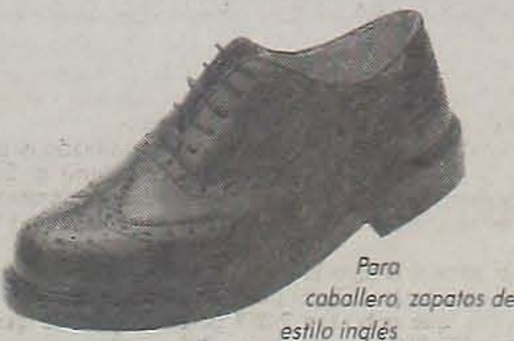
Para caballero, zapatos de estilo inglés