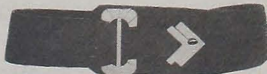
Una gran selección de cinturones en todos los colores de moda.