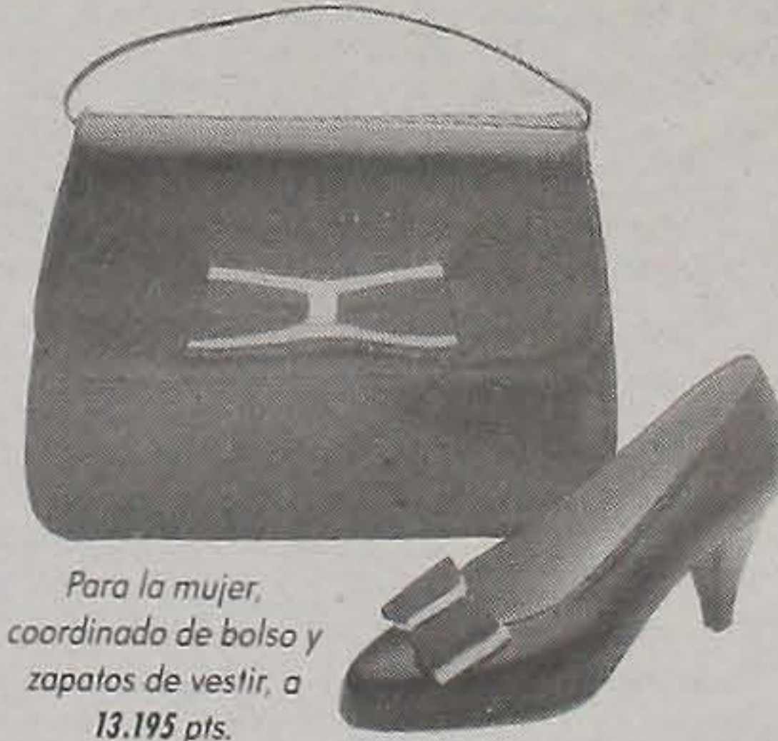
Para la mujer, coordinado de bolso y zapatos de vestir, a 13.195 pts.

El Otoño nos trae una pareja de plena moda: los zapatos y los complementos. Cinturones, corbatas, guantes, medias, sombreros... elija los que mejor van con su estilo.