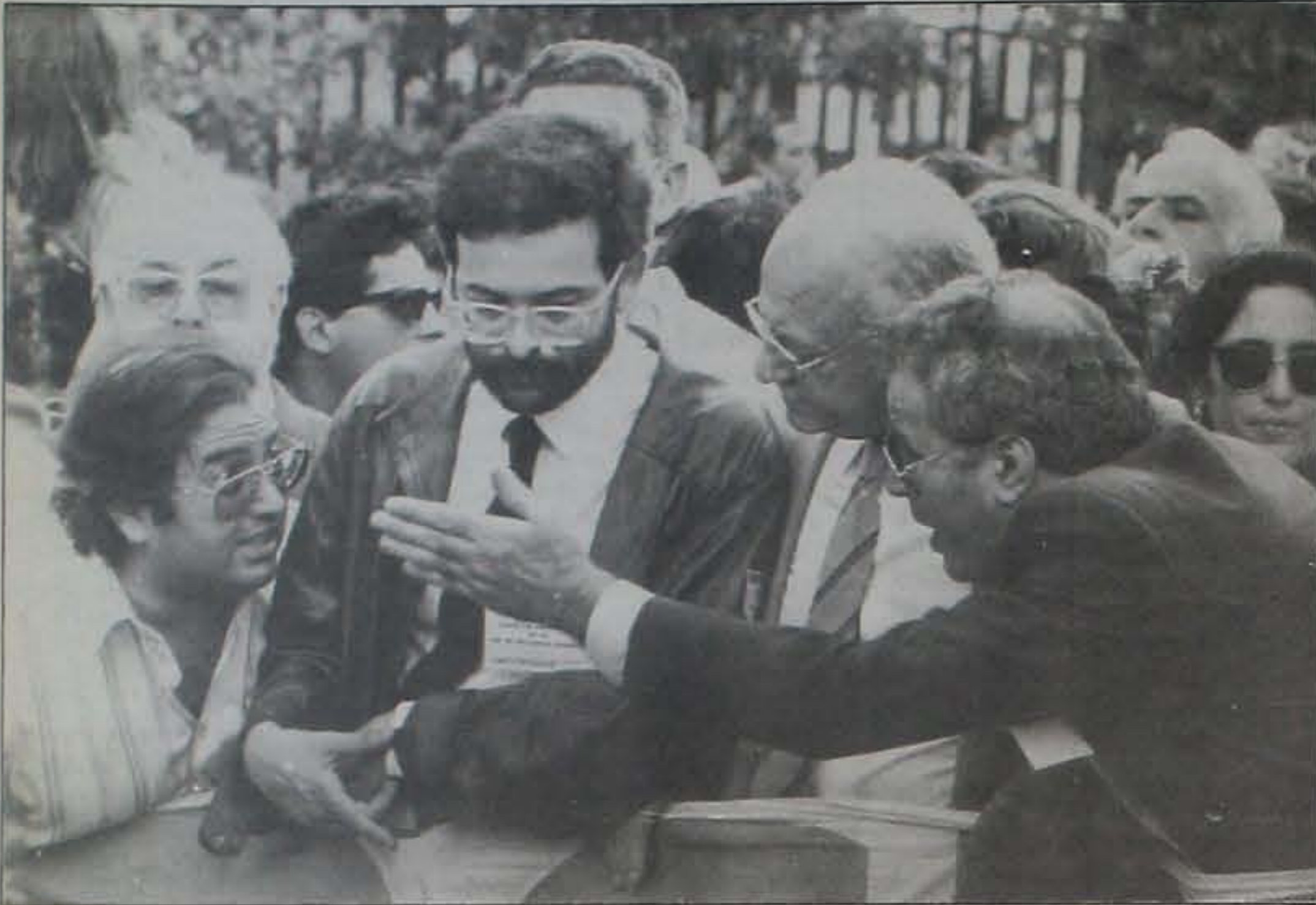
ULTIMOS DETALLES DE LOS ORGANIZADORES Todo estaba a punto. Los organizadores, en la cabecera de la manifestación, intercambiaban criterios sobre los detalles de la histórica marcha. Fue una jornada inolvidable para la ciudad de Las Palmas de Gran Canaria.