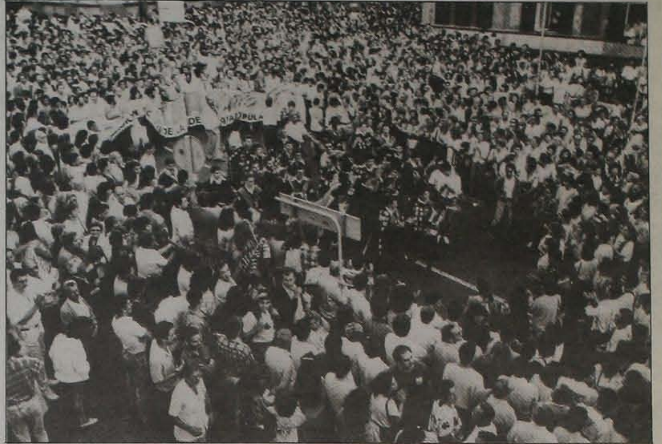
LOS «TUNOS», LOS MAS APLAUDIDOS La Tuna de la Universidad Politécnica de Canarias fue lo más aplaudido a su paso. Animó y puso el color a la manifestación, además de la Banda de Guayedra. Fue una reivindicación alegre y lúdica, sin violencias de ningún tipo.