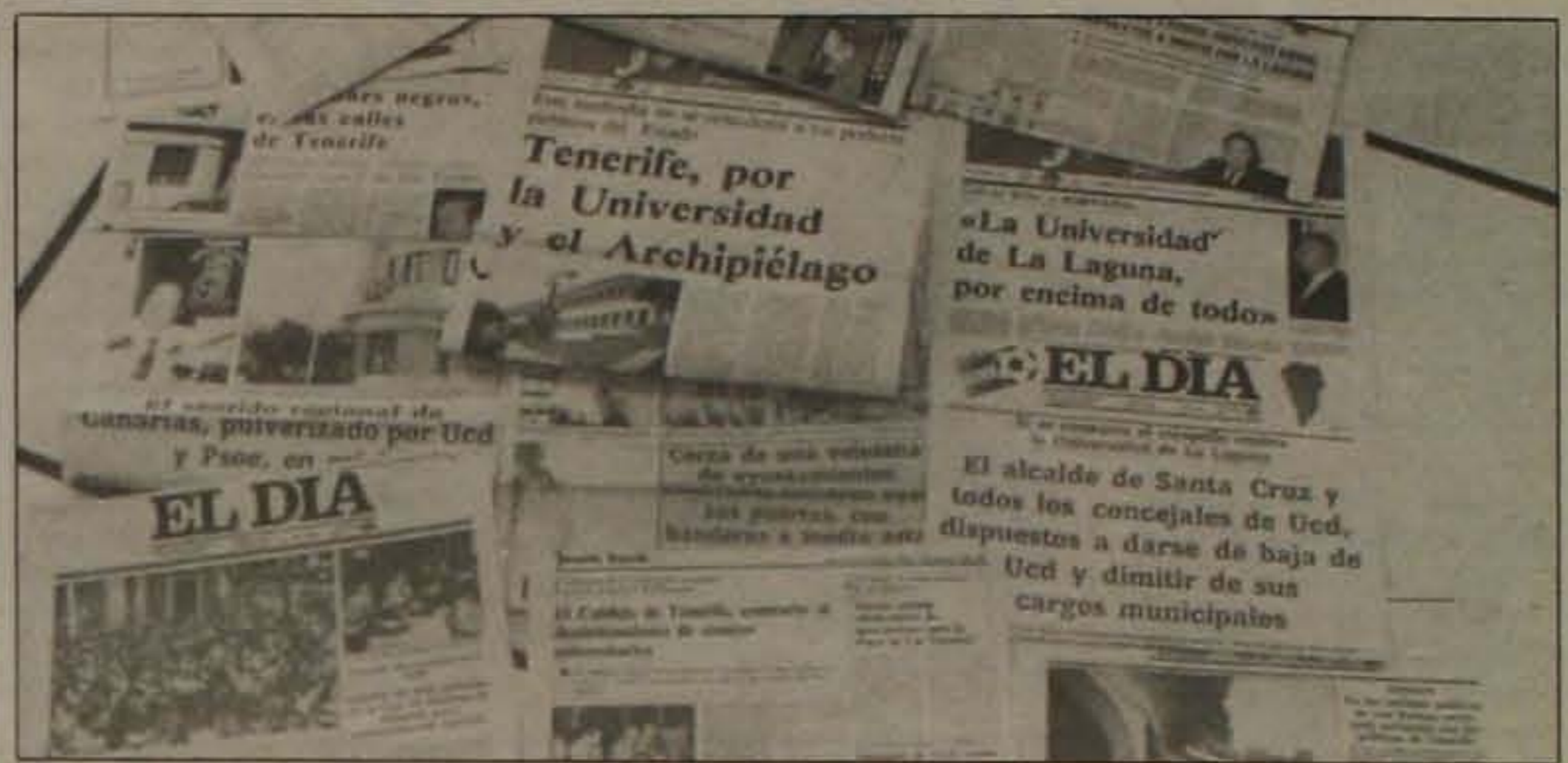
La prensa tinerfeña siempre ha mantenido la indivisibilidad de La Laguna

4.º— Cada Universidad seguirá rigiéndose por los estatutos de origen actualmente en vigor, pero cada una de ellas en un plazo de seis meses, a partir del día de vigencia de la presente Ley, elaborará sus propios estatutos por los que habrá de regirse en lo sucesivo. Si transcurrido el plazo señalado alguna Uni-