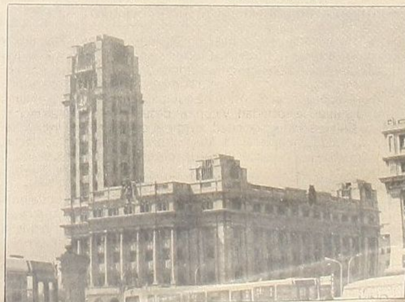
El Cabildo tinerfeño reitera «su firme voluntad» de defender la Universidad de La Laguna

Indicaba el Cabildo que, en principio, las enseñanzas podrían ser las de Ingeniería Técnica en Energía y Combustible, Energía y Materiales, Protección del Medio Ambiente, Sondeos y Prospecciones, Energía, Metalurgia y Materiales, y Geología y Prospección.