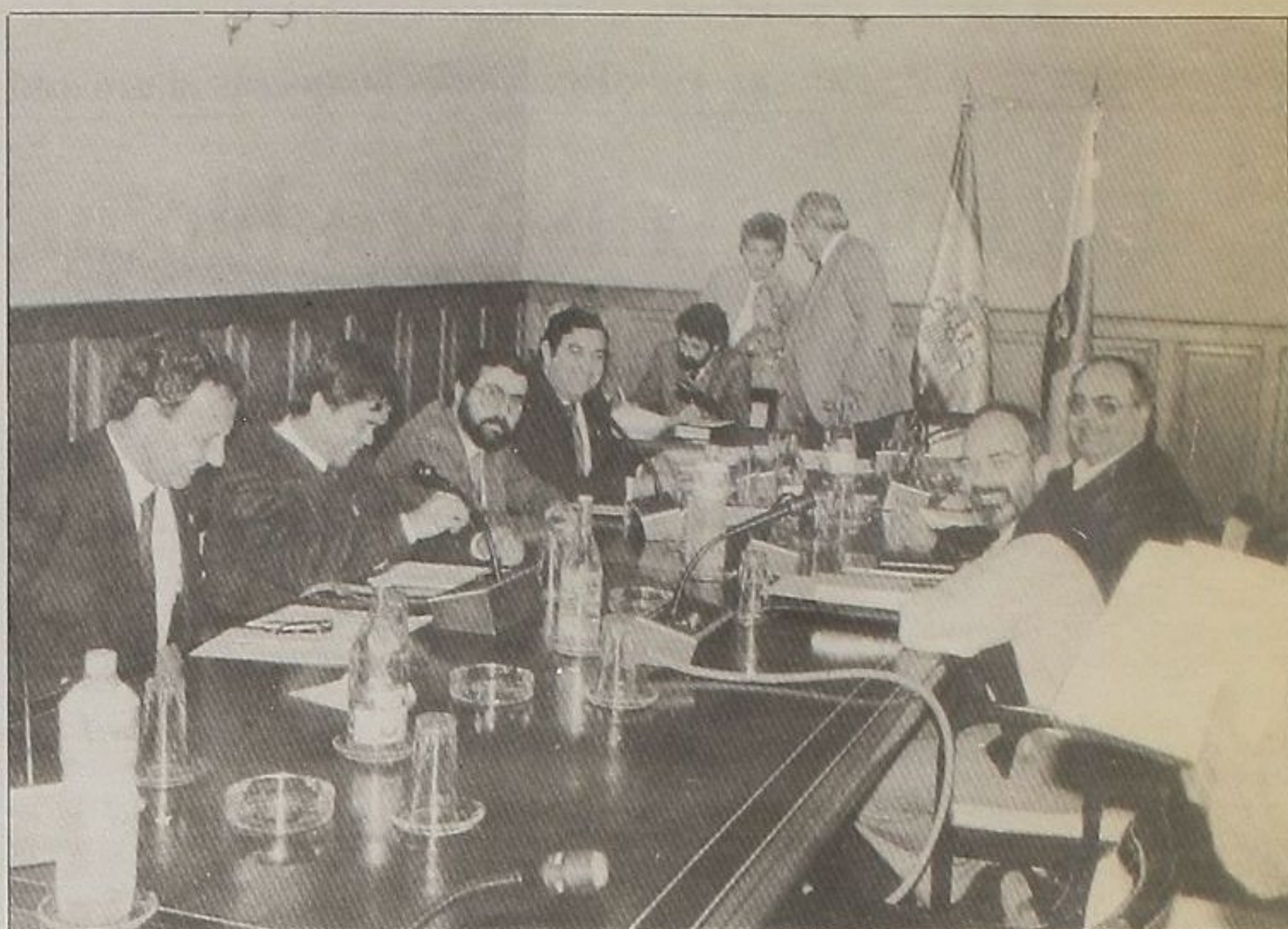
Un momento de la reunión de la Junta de Portavoces en el Parlamento de Canarias