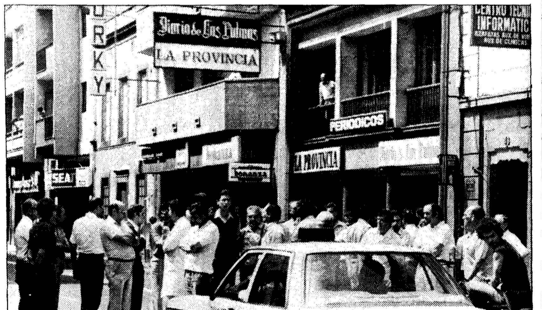
Una instantánea del paro ciudadano de dos minutos en la calle, al mediodía de ayer.