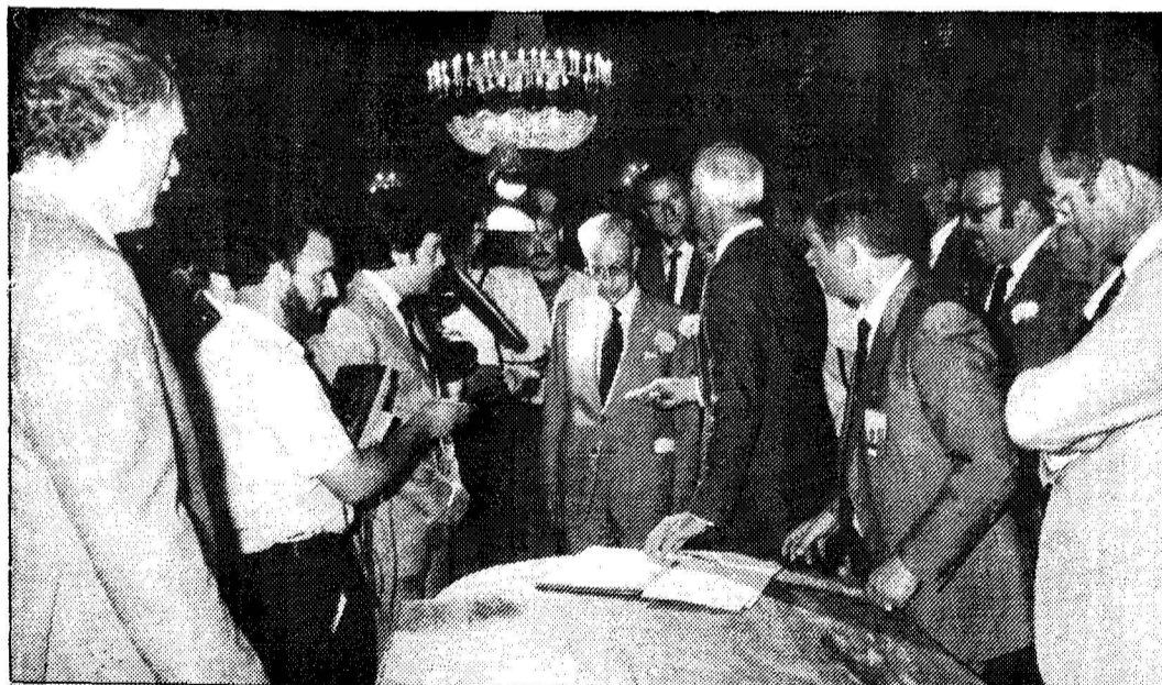
En el Gobierno Civil, los alcaldes y el presidente del Cabildo firman el manifiesto.

(Más información en las páginas centrales)